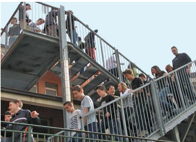
Esercitazione di evacuazione.

Almeno due volte l'anno nella scuola devono essere attuate esercitazioni di evacuazione , per verificare l'apprendimento delle procedure e dei comportamenti previsti dal piano di evacuazione. Al termine dell'esercitazione, all'interno della scuola e delle singole classi, vengono analizzati comportamenti, disfunzioni o errori al fine di correggerli.