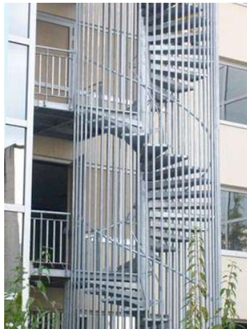
Scala di emergenza.