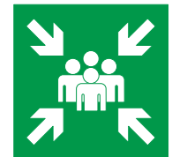
Punto di raccolta