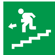
Scala di emergenza