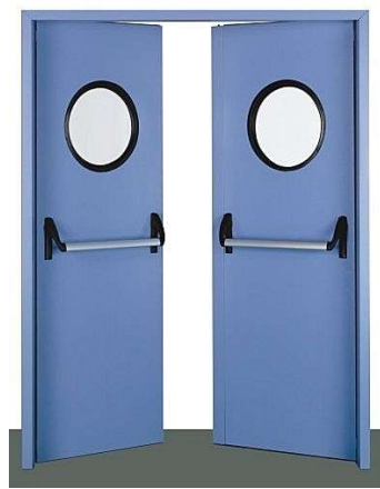
Porta di emergenza con maniglioni antipanico.