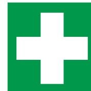
Cassetta primo soccorso