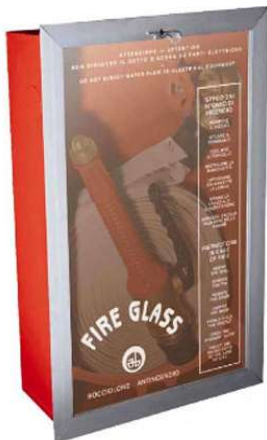
Cassetta per idrante.