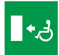
Percorso per l'uscita di emergenza per disabili