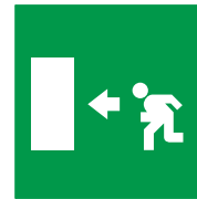
Percorso per l'uscita di emergenza